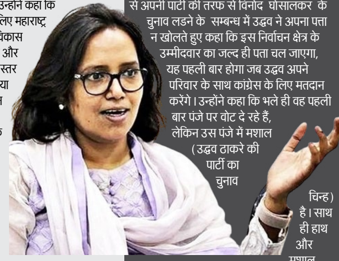
चिन्ह है। साथ ही हाथ और मशाल

पूर्व सीएम ने कहा कि वर्षा गायकवाड़ जिस सीट से चुनाव लड़ रही हैं। वह मेरा गृह निर्वाचन क्षेत्र है। ऐसे में मैं भी वर्षा के पक्ष में मतदान करूंगा। उत्तर मुंबई से अपनी पार्टी की तरफ से विनोद घोसालकर के चुनाव लड़ने के सम्बन्ध में उद्धव ने अपना पता न खोलते हुए कहा कि इस निर्वाचन क्षेत्र के उम्मीदवार का जल्द ही पता चल जाएगा, यह पहली बार होगा जब उद्धव अपने परिवार के साथ कांग्रेस के लिए मतदान करेंगे। उन्होंने कहा कि भले ही वह पहली बार प्रेजे पर वोट दे रहे हैं, लेकिन उस प्रेजे में मशाल (उद्धव ठाकरे की पार्टी का चुनाव चिन्ह) है। साथ ही हाथ और मशाल एकजुट होकर मुरत ( राकां शरद पवार गुट का चुनाव चिन्ह ) बजाने जा रहे हैं। इसलिए महाराष्ट्र में मानिआ की जीत निश्चित है।