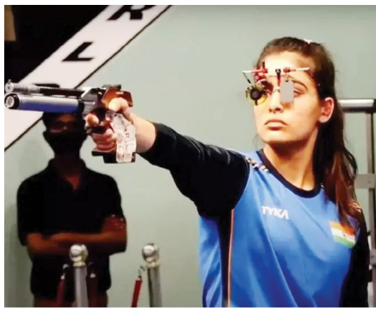
नई दिल्ली

निशानेबाज मनु भाकर पेरिस ओलंपिक में दो स्पर्धाओं में चुनौती पेश करेंगी। मंगलवार को राइफल और पिस्टल की 15 सदस्यीय टीम में घोषित की। इसमें हरियाणा की निशानेबाज मनु 10 मीटर एयर पिस्टल के साथ 25 मीटर पिस्टल सहित दो स्पर्धाओं में भाग लेने वाली अकेली खिलाड़ी हैं। भारतीय निशानेबाजी महासंघ की टीम में आठ राइफल और सात पिस्टल निशानेबाज हैं।