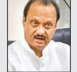
कि केंद्रीय मंत्रिमंडल में स्वतंत्र प्रभार वाले राज्य मंत्री का पद स्वीकार करना उनके लिए डिमोशन माना जाएगा, क्योंकि वे पहले केंद्र में कैबिनेट मंत्री थे।