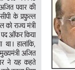
शरद पवार ने मुंबई में मीडिया से बातचीत करते हुए कहा कि जो नेता या विधायक पार्टी को कमजोर करना चाहते हैं, उन्हें शामिल नहीं किया जाएगा। लेकिन, जो लोग संगठन को मजबूत करने में मदद करेंगे और पार्टी की छवि को नुकसान नहीं पहुंचाएंगे, ऐसे ही नेताओं को पार्टी में एंटी मिलेंगी। हालांकि, उन्होंने यह भी साफ कर दिया कि पार्टी के नेताओं और कार्यकर्ताओं से बात करने के बाद ही यह भी फैसला लिया जाएगा।