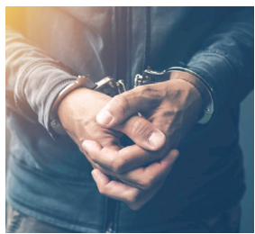
इसके साथ ही पुलिस ने मामले के सिलसिले में अब तक कुल नौ लोगों को गिरफ्तार किया है।

नवी मुंबई पुलिस ने मध्य प्रदेश के इंदौर से संचालित एक फर्जी कॉल सेंटर का भंडाफोड़ किया है। साथ ही 27 साल के एक शख्स को गिरफ्तार किया है। पुलिस एक अधिकारी ने मंगलवार को जानकारी देते हुए कहा कि पुलिस ने यह कार्रवाई ऑनलाइन शोपर ट्रेडिंग धोखाधड़ी मामले की जांच के तहत की है। उन्होंने बताया कि