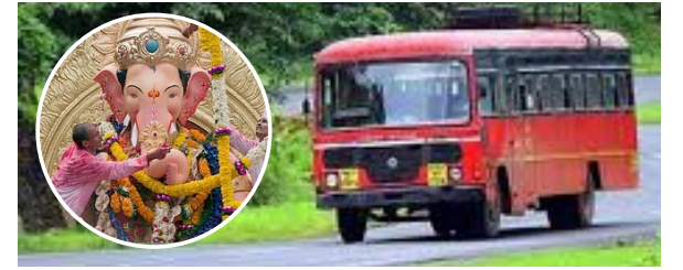
दोपहर संवाददाता | ठाणे

सात अगस्त से भगवान गणेश का आगमन होगा। भगवान गणेश के स्वागत के लिए एसटी महामंडल तैयार है। गणेशोत्सव महाराष्ट्र का सबसे बड़ा धार्मिक पर्व है। इस पर्व को मनाने के लिए कोंकण वासियों को यात्रा करना जान पर आ जाता है। इसके देखते हुए एसटी महामंडल 2 सितंबर से 17 सितंबर के बीच में चार हजार तीन सौ अधिक गाड़ियों को छोड़ने के लिए निर्णय लिया है। टिकट दर में वरिष्ठ नागरिकों के लिए सौ प्रतिशत और महिलाओं के लिए पचास प्रतिशत की सहूलियत व्यवहित आरक्षण व सामूहिक आरक्षण में वरिष्ठ नागरिकों के लिए सौ प्रतिशत और महिलाओं के लिए टिकट दर में पचास प्रतिशत की सहूलियत होगी 12 सितंबर से मुंबई, ठाणे, पालघर के मुख्य एसटी स्टैंड से अधिक बसों को छोड़ा जायेगा। हर साल साढ़े तीन हजार बसों को छोड़ा जाता था। इस बार यात्रियों की मांग पर आठ सौ अधिक बसों को शामिल किया गया है।