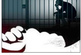
दोपहर संवाददाता | पालघर

ट्रेनों में कई बार ऐसी घटनाएं हो जाती हैं, जिसे रेलवे के दावों की पोल खुल जाती है। एक चलती ट्रेन में 35 वर्षीय महिला के साथ छेड़छाड़ करने को लेकर पालघर से एक युवक को गिरफ्तार किया गया है। एक अधिकारी ने बुधवार को यह जानकारी दी। यह घटना 30 जुलाई को हुई, जब 22 वर्षीय आरोपी मुंबई जाने वाली सोराष्ट्र मेल में यात्रा कर रहा था और शिकायतकर्ता महिला निचली बर्थ पर सो रही थी।