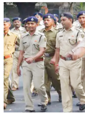
मेडिकल एग्जामिनेशन सभी चरणों में सफल उम्मीदवारों

लिखित परीक्षा फिजिकल फिटनेस टेस्ट (PFT) फिजिकल एन्ड्योरेंस टेस्ट (PET)