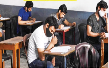
लिए इच्छुक उम्मीदवार किसी मान्यता प्राप्त शैक्षणिक संस्थान से कक्षा 12वीं उत्तीर्ण होने चाहिए। ► मेट्रन के लिए मान्यता प्राप्त शैक्षणिक संस्थान से कक्षा 12वीं पास उम्मीदवार।

पं जाब अधीनस्थ सेवा चयन बोर्ड (पीएसएसएसबी) ने जेल वार्डर व मेट्रन के 179 पदों पर भर्ती निकाली है। वार्डर के 175 पदों और मेट्रन के 4 पदों पर भर्ती निकली है। इच्छुक उम्मीदवार बोर्ड की वेबसाइट sssb.punjab.gov.in पर जाकर 29 जुलाई से 20 अगस्त 2024 शाम 5 बजे तक ऑनलाइन अप्लाई कर सकते हैं।