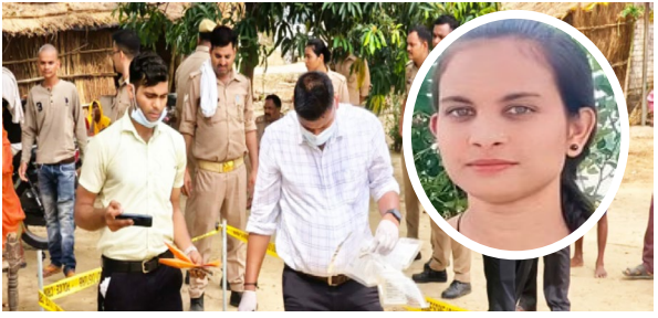
एजेंसी | भदोही

भदोही में कोइरौला थाना क्षेत्र के अरई गांव में एक ही परिवार के तीन सदस्यों ने विषाक्त पदार्थ का सेवन कर लिया। अस्पताल ले जाने पर मां-बेटी की मौत हो गई। बेटे की हालात गंभीर होने पर रेफर कर दिया गया। घटना के पीछे घरेलू विवाद और आर्थिक हालात खराब होने की बात सामने आ रही है। मृत महिला के भाई की तहरीर पर पुलिस ने उसकी सास और जेटानी के खिलाफ केस दर्ज किया है। बताया जा रहा है कि उनसे जमीन का विवाद चल रहा था।