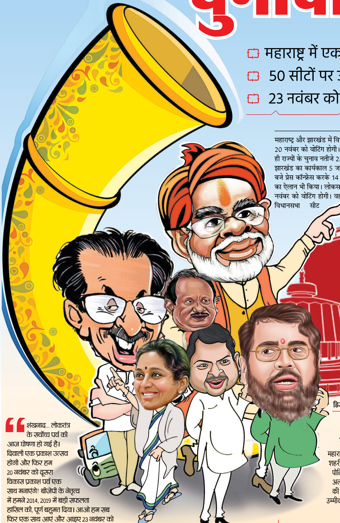
डिजाइन : सतीशचंद्र शर्मा

महाराष्ट्र और झारखंड में विधानसभा चुनाव की तारीखों का ऐलान हो गया है। महाराष्ट्र में सिंगल फेज में 20 नवंबर को वोटिंग होगी। वहीं झारखंड में 2 फेज में 13 और 20 नवंबर को वोट डाले जाएंगे। दोनों ही राज्यों के चुनाव नतीजे 23 नवंबर को आएंगे। महाराष्ट्र विधानसभा का कार्यकाल 26 नवंबर को और झारखंड का कार्यकाल 5 जनवरी 2025 को खत्म हो रहा है। चुनाव आयोग ने मंगलवार दोपहर 3.30 बजे प्रेस कॉन्फ्रेंस करके 14 राज्यों की 48 विधानसभा और 2 लोकसभा सीटों पर उपचुनाव की तारीखों का ऐलान भी किया। लोकसभा सीटों में केरल की वायनाड में 13 नवंबर और महाराष्ट्र के नांदेड़ में 20 नवंबर को वोटिंग होगी। वहीं, 47 विधानसभा सीटों पर 13 नवंबर को और उत्तराखंड की केदारनाथ विधानसभा सीट पर 20 नवंबर को मतदान होगा। सभी के नतीजे 23 नवंबर को आएंगे।