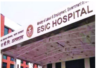
मेरठ। मेरठ के कंकरखेड़ा में जल्द ही एक नया कर्मचारी राज्य बीमा (ईएसआई) अस्पताल स्थापित होने जा रहा है, जिसका भूमि पूजन मुख्यमंत्री योगी आदित्यनाथ ने किया। 148 करोड़ रुपये की लागत से बनने वाला यह 100-बेड का अस्पताल क्षेत्र के लगभग एक

लाख कर्मचारियों और उनके परिवारों के लिए लाभकारी होगा। इस अवसर पर प्रधानमंत्री नरेंद्र मोदी भी वर्चुअल रूप से कार्यक्रम में शामिल हुए, जबकि केंद्रीय श्रम, रोजगार व खेल मंत्री डॉ. मनसुख मांडविया ने भी इस परियोजना के महत्व को रेखांकित किया।