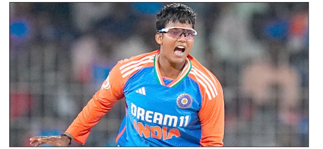
एजेसी | मुंबई

भारतीय ऑफ स्पिनर दीप्ति शर्मा आईसीसी महिला वनडे गेंदबाजों की रैंकिंग में वह करियर की सर्वश्रेष्ठ दूसरी रैंकिंग पर पहुंच गई हैं। न्यूजीलैंड के खिलाफ पहले दो वनडे में शानदार प्रदर्शन के चलते दीप्ति के 687 रैंकिंग अंक हो गए हैं जो करियर के सर्वाधिक हैं। उन्होंने इंग्लैंड की केट क्रॉस (तीसरे नंबर) और ऑस्ट्रेलिया में मेगना शट (चौथे नंबर) को पछाड़ा। इंग्लैंड सोफी एक्सेलेटन शीर्ष पर हैं। न्यूजीलैंड की ली ताहूहू (तीन पायदान चढ़कर 12वें), एमेलिया केर (एक ऊपर 13वें) और सोफी डिविइन (9 पायदान ऊपर 30वें) को भी रैंकिंग में फायदा हुआ है। बल्लेबाजी रैंकिंग में मंधाना एक स्थान नीचे चौथे स्थान पर खिसक गई हैं। वहीं कप्तान हरमनप्रीत कौर तीन स्थान के नुकसान से शीर्ष दस से बाहर हो गईं। वह 12वें स्थान पर खिसक गईं। जेमिमा तीन पायदान चढ़कर 30वें स्थान पर पहुंच गईं। न्यूजीलैंड की डिविइन आठवें और केर 11वें स्थान पर पहुंच गईं।