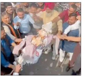
श्रीनगर

▶▶ बीजेपी विधायकों का हंगामा, दस्तावेज की कॉपी फाड़ी ▶▶ CM उमर अब्दुल्ला का पुतला जलाया