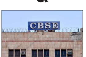
एजेंसी | नई दिल्ली

सीबीएसई ने डमी स्कूलों के खिलाफ कार्रवाई करते हुए बुधवार को 21 विद्यालयों की संबद्धता वापस ले ली। इसमें से 16 दिल्ली, जबकि पांच राजस्थान के कोचिंग हब कोटा और सीकर में हैं। इसके अलावा छह स्कूलों का उच्चतर माध्यमिक (12वीं) का दर्जा घटाकर माध्यमिक (10वीं) कर दिया गया। यह कदम सितंबर में राजस्थान और दिल्ली के विद्यालयों में किए