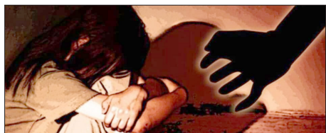
एजेंसी | पुडुचेरी

▶▶ पहले ऑटो वाले ने फिर आईटी कर्मियों ने गैंगरेप किया