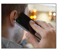
एजेंसी | नई दिल्ली

▶▶ विशिंग हमलों को लेकर सरकारी अफसरों को एडवाइजरी जारी