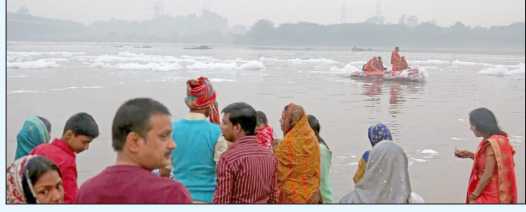
एजेंसी | नई दिल्ली

■ हाईकोर्ट ने याचिका खारिज की कहा- पानी बहुत ज्यादा प्रदूषित इससे लोगों की सेहत बिगड़ेगी