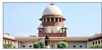
एजेंसी | नई दिल्ली

▶▶ सुप्रीम कोर्ट ने 2017 का फैसला बरकरार रखा