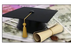
एजेंसी | नई दिल्ली

▶▶ पीएम विद्यालक्ष्मी योजना को कैबिनेट की मंजूरी