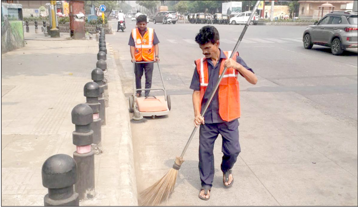
डीबीडी संवाददाता | नवी मुंबई