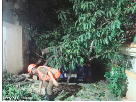
डीबीडी संवाददाता | ठाणे

राउत स्कूल, सुदर्शन कॉलोनी, कोपरी (पूर्व) के नाइक बंगला परिसर में एक पेड़ आशीष बिल्डिंग परिसर में खड़े दो चार पहिया वाहनों पर गिर गया। कोपरी पुलिस स्टेशन के अधिकारी और कर्मचारी, अग्निशमन विभाग का एक कर्मी जीप सहित, वृक्ष प्राधिकरण विभाग के कर्मचारी और आपदा प्रबंधन कक्ष का एक कर्मी पिकअप वाहन सहित घटनास्थल पर पहुंचे। सूचना के अनुसार घटना में कोई हताहत नहीं हुआ। घटना स्थल पर गिरा पेड़ आपदा प्रबंधन प्रकोष्ठ और वृक्ष प्राधिकरण विभाग के कर्मचारियों की मदद से काटकर सुरक्षित तरीके से हटा दिया गया।