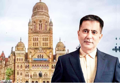
डीबीडी संवाददाता | मुंबई