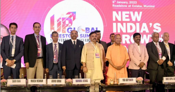
निवेश सुविधा एजेंसी के रूप में होगी सशक्त भूमिका

मुख्यमंत्री योगी आदित्यनाथ ने सोमवार को इन्वेस्ट यूपी को अधिक कार्यक्रमशाल, विशेषज्ञता आधारित और निवेशक केंद्रित संस्था के रूप में विकसित करने के निर्देश दिए। उनकी अध्यक्षता में हुई इन्वेस्ट यूपी शासी निकाय की पहली बैठक में संस्था के पुनर्गठन प्रस्ताव को मंजूरी दी गई। नए ढांचे के तहत टेक्सटाइल, ऑटोमोबाइल एवं इलेक्ट्रिक मोबिलिटी, केमिकल, इलेक्ट्रॉनिक्स और सर्विस सेक्टर के लिए अलग-अलग विशेषज्ञ सेल बनाए जाएंगे। साथ ही मुंबई, बेंगलुरु, हैदराबाद, चेन्नई और नई दिल्ली में सैटेलाइट इन्वेस्टमेंट प्रमोशन ऑफिस स्थापित होंगे, ताकि घरेलू और विदेशी निवेशकों से सीधा संवाद स्थापित किया जा सके।