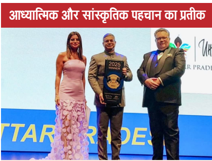
आध्यात्मिक और सांस्कृतिक पहचान का प्रतीक