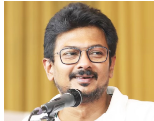
एजेंसी | चेन्नई

तमिलनाडु में हिंदी की कोई जगह नहीं: उदयनिधि स्टालिन