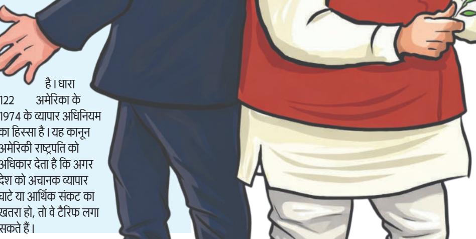
है। धारा 122 अमेरिका के 1974 के व्यापार अधिनियम का हिस्सा है। यह कानून अमेरिकी राष्ट्रपति को अधिकार देता है कि अगर देश को अचानक व्यापार घाटे या आर्थिक संकट का खतरा हो, तो वे टैरिफ लगा सकते हैं।

अमेरिकी राष्ट्रपति ट्रंप का कहना है कि वह उन जजों से 'बहुत शर्मिदा' हैं जिन्होंने 'बहुत निराशाजनक' टैरिफ फैसला सुनाया। ट्रंप ने कहा कि वह 1974 के ट्रेड एक्ट के संरक्षण 122 के तहत 10% ग्लोबल टैरिफ लगाने के ऑर्डर पर साइन करेंगे और कई दूसरी जांच भी शुरू करेंगे। यह कानून राष्ट्रपति को सभी देशों पर 150 दिनों तक 15% तक इयूटी लगाने की इजाजत देता है। इसके लिए जांच या दूसरी प्रोसीजरल लिमिट लगाने की जरूरत नहीं है। धारा 122 अमेरिका के 1974 के व्यापार अधिनियम का हिस्सा है। यह कानून अमेरिकी राष्ट्रपति को अधिकार देता है कि अगर देश को अचानक व्यापार घाटे या आर्थिक संकट का खतरा हो, तो वे टैरिफ लगा सकते हैं।