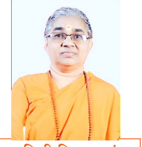
स्वामिनी निष्कलानंदा चिन्मय मिशन कल्याण