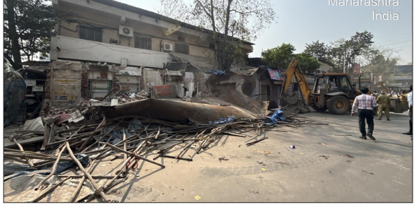
अवैध फेरीवालों के खिलाफ कठोर कदम उठाने की बात कही थी। पदभार ग्रहण के तुरंत बाद कार्रवाई शुरू होने से यह संदेशा गया है कि नई महापौर प्रशासनिक सख्ती को लेकर गंभीर है।

मनपा के 'टी' विभाग द्वारा 11 फरवरी 2026 को मुलुंड (पश्चिम) स्थित सरदार वल्लभभाई पटेल मार्ग पर अभियान चलाया गया। कार्रवाई के दौरान करीब 1100 वर्ग मीटर क्षेत्र को अतिक्रमण मुक्त कराया गया।