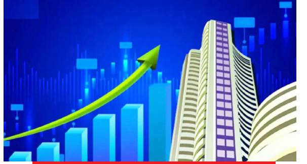
5.51 लाख करोड़ बढ़ी संपत्ति

घरेलू शेयर बाजार लगातार तीसरे कारोबारी दिन मजबूती के साथ बंद हुआ। आज का कारोबार मजबूत वैश्विक संकेतों, कच्चे तेल की कीमतों में नरमी, आईटी सेक्टर में खरीदारी और इंडिया जेनेरैटिविटी इंडेक्स (इंडिया जीआईएक्स) में गिरावट के कारण पॉजिटिव माहौल में रहा। शुरुआती एक घंटे के उतार-चढ़ाव के बाद खरीदारों ने जेअरदार लिक्विडिटी की, जिससे सेंसेक्स और निफ्टी दोनों में तेजी आई। दिन के अंत में सेंसेक्स 296.09 अंक की बढ़त के साथ 76,704.13 अंक पर और निफ्टी 196.65 अंक की मजबूती के साथ 23,777.80 अंक पर बंद हुआ।