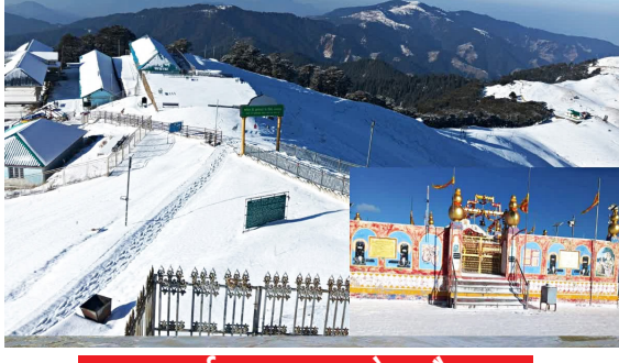
24 मार्च तक खराब रहेगा मौसम

हिमाचल प्रदेश में मौसम का मिजाज लगातार बिगड़ता जा रहा है। राज्य के ऊंचाई वाले क्षेत्रों में ताजा बर्फबारी से ठंड बढ़ गई है, जबकि शिमला, मनाली और निचले क्षेत्रों में घने बादल छाए हुए हैं। मौसम विभाग ने 20 मार्च तक ऑरेंज अलर्ट जारी किया है और लोगों को सतर्क रहने की सलाह दी है। विभाग ने भारी बारिश, बर्फबारी और ओलावृष्टि के साथ 40-60 किलोमीटर प्रति घंटा की रफ्तार से तेज हवाओं की संभावना जताई है। तापमान की बात करें तो शिमला में न्यूनतम 10 डिग्री, मनाली 3.1 डिग्री, कल्पा 0.9 डिग्री और तांबो -2.8 डिग्री सेल्सियस दर्ज किया गया है। कुल्लू, सोलन, कांगड़ा और मंडी समेत कई जिलों में भी ठंड बनी हुई है।