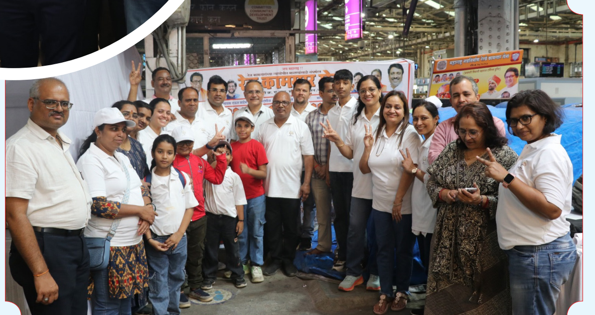
निर्झरिणी ट्रस्ट के सदस्य एवं ठाणे सिविल अस्पताल के डाक्टरों की टीम