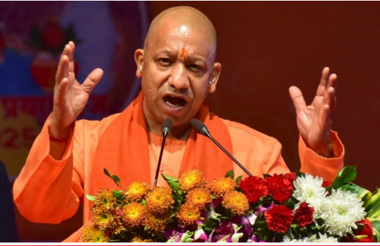
लॉ एंड आर्डर, इंफ्रास्ट्रक्चर में बड़े बदलाव

मुख्यमंत्री योगी आदित्यनाथ ने कहा कि पिछले नौ वर्षों में उत्तर प्रदेश ने 'बॉटल नेक' से 'ब्रेकथ्रू स्टेट' तक का सफर तय किया है, जो प्रधानमंत्री नरेंद्र मोदी के मार्गदर्शन में संभव हुआ। लोकभवन में 'नवनिर्माण के नौ वर्ष' कार्यक्रम के दौरान उपलब्धियों की पुस्तिका का विमोचन करते हुए उन्होंने यह बात कही। योगी ने कानून-व्यवस्था, इंफ्रास्ट्रक्चर, निवेश, रोजगार और कल्याणकारी योजनाओं में बड़े बदलाव का दावा किया। उन्होंने बताया कि प्रदेश में उद्योग, एयरपोर्ट, सड़क कनेक्टिविटी और एमएसएमई क्षेत्र में तेजी आई है।