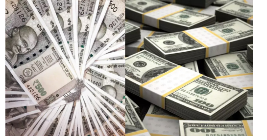
92.63 रुपये पर थमी गिरावट

भारतीय रुपये ने बुधवार को अमेरिकी डॉलर के मुकाबले 23 पैसे की गिरावट के साथ 92.63 प्रति डॉलर (अस्थायी) के रिकार्ड निचले स्तर को छू लिया। विदेशी निवेशकों की लगातार निकासी और वैश्विक बाजारों में बढ़ते तेल के दामों ने रुपया कमजोर होने में अहम भूमिका निभाई। फोरेक्स ट्रेडर्स ने बताया कि पश्चिम एशिया में तनाव और कच्चे तेल की ऊंची कीमतों के चलते वैश्विक निवेशकों का रुख सतर्क रहा।