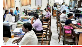
साड़ी, सलवार-सूट और औपचारिक परिधान

हिमाचल प्रदेश सरकार ने अपने कर्मचारियों के लिए ड्रेस कोड और सोशल मीडिया व्यवहार को लेकर सख्त आदेश जारी किया है। अब दफ्तरों में जींस और टी-शर्ट पर पूरी तरह रोक रहेगी। कर्मचारियों को केवल औपचारिक व सादे कपड़े पहनने होंगे। साथ ही बिना अनुमति किसी भी सरकारी दस्तावेज या जानकारी को साझा करने पर सख्त कार्रवाई की चेतावनी दी गई है। सभी विभागों को इन निर्देशों का पालन सुनिश्चित करना होगा और आदेश की प्राप्ति की पुष्टि करनी होगी।