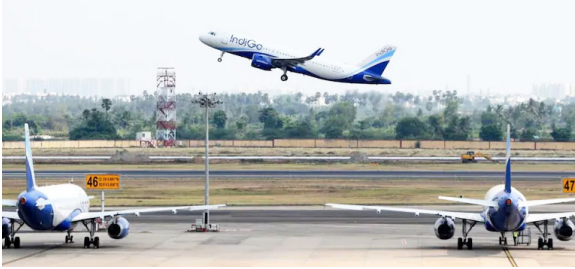
एक पीएनआर पर पास-पास मिलेगी सीट

केंद्रीय नागरिक उड्डयन मंत्रालय ने हवाई यात्रा को यात्रियों के लिए और सहज बनाने हेतु बुधवार को नए दिशा-निर्देश जारी किए। इन निर्देशों के तहत प्रत्येक उड़ान में कम से कम 60 प्रतिशत सीटें बिना अतिरिक्त शुल्क के उपलब्ध कराना अनिवार्य होगा। इसका उद्देश्य यह सुनिश्चित करना है कि सभी यात्री समान अवसर के साथ सीट चुन सकें और पारदर्शी सेवा का लाभ उठा सकें।