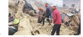
नींव खोदे जाने से कमजोर हुई थी दीवार